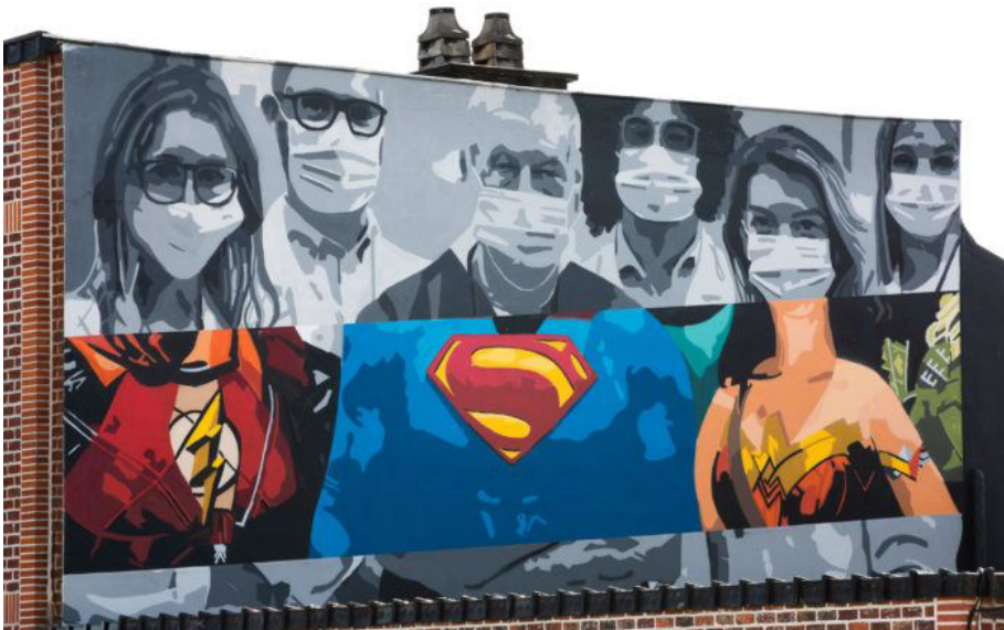
FIGURA 4 | Mural en homenaje a los trabajadores sanitarios en Sint-Martens-Lennik, Bélgica

Fuente: Une fresque de street art (2020).