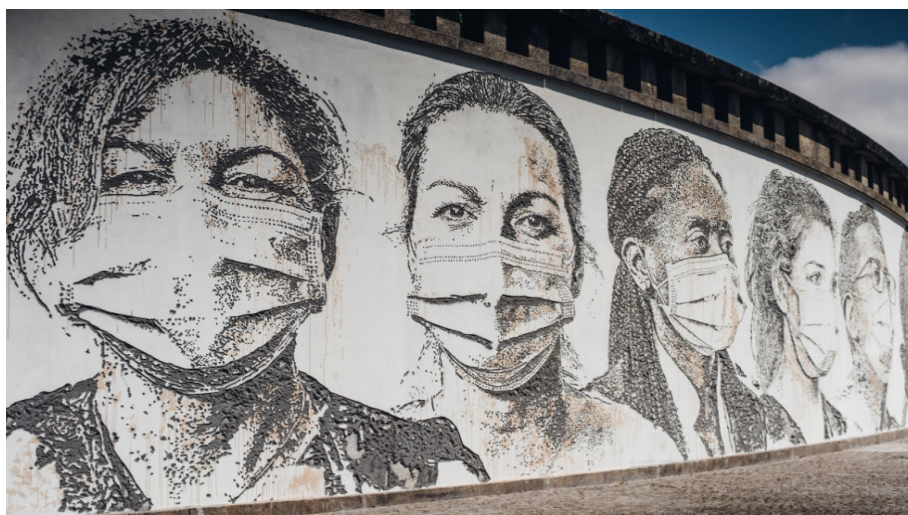
FIGURA 2 | Mural en homenaje a los trabajadores sanitarios en Lisboa, Portugal