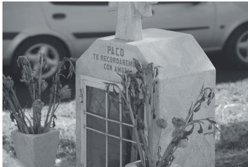
Fotografía 2: Nicho ubicado en la lateral del Anillo Periférico Sur, en la que se aprecia el nombre del difunto y la dedicatoria. Fotografía tomada por autora en enero de 2009

En el caso contemporáneo, esta muerte violenta se asocia también a un viaje que los familiares deben facilitar por medio de cruces, rezos, inciensos y ofrendas. Implica –a diferencia de las creencias católicas 11 –, que la muerte violenta tiene un tratamiento especial.