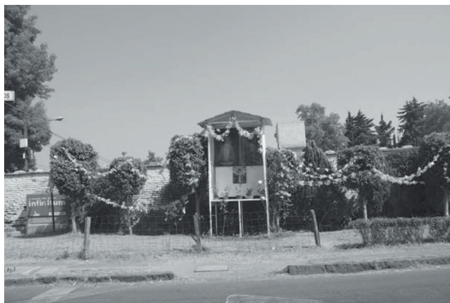
Fotografía 3: Altar en la calle de San Marcos, barrio de Santa Úrsula Xitle, Tlalpan.

También los encontramos en esos intersticios de la ciudad que no tienen un uso claro, que por sus características no sirven para nada, o cuya propiedad no está claramente establecida: una pequeña porción de tierra en la que no se puede construir, el espacio entre construcciones, un borde de una barranca, una calle cerrada con poca luz, etc., que se convierten con facilidad en lugares peligrosos.