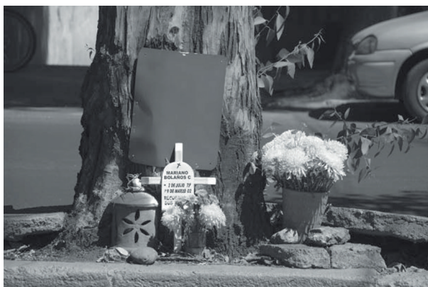
Fotografía 1: Cruz ubicada en San Fernando, Delegación Tlalpan.

¿Por qué se coloca allí la cruz? ¿No es suficiente la tumba en el cementerio? Al parecer no lo es. Algunos entrevistados aluden al hecho de que si no se coloca la cruz en el lugar del deceso, la persona no encuentra la paz. Algunos consideran que hay una suerte de doble tumba: una tumba para el alma –que se ubica en el lugar